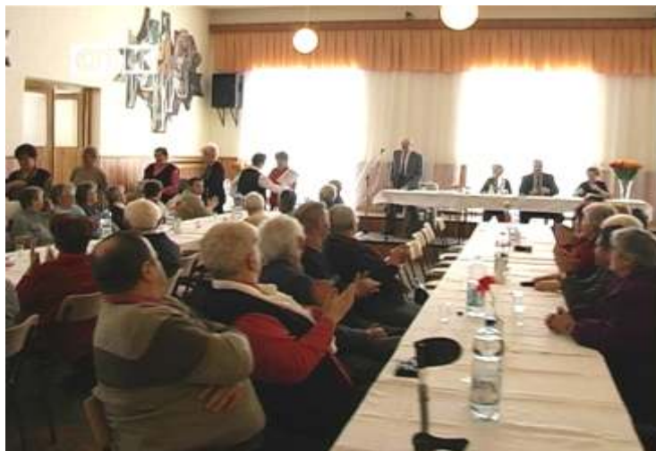
z výročnej schôdze dôchodcov