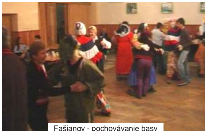
Fašiangy - pochovávanie basy