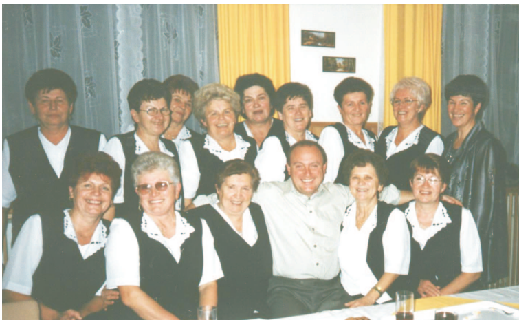
V minulom roku (2002) sa ženská spevácka skupina dočkala už 30. rokov od svojho založenia