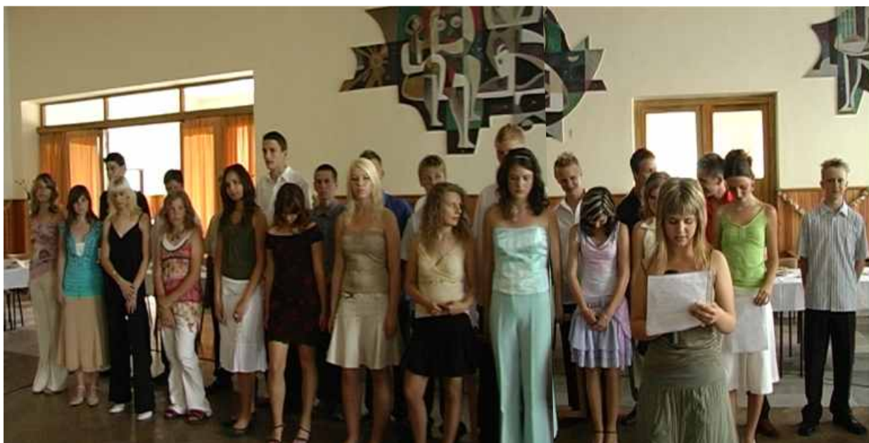
Večierok 9.-tého ročníka

A už iba niekoľko viet, máličko viet. A v nich zopár slov. Slová o škole, šťastí, slová o budúcnosti ... A potom? Srdcia plné elánu, nadšenia. Prvé odvážne kroky ... Prvé ľahké vzlety ... O čom boli tie slová, tie vety? O všetkom, len o tom nie, ako ťažko bolí lúčenie. Dovidenia!