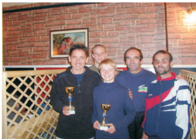
Vítazi tohtoročného preteku "Od pamätníka k pamätníku"